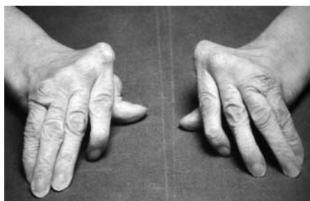
Abb. 2 Erhebliche Ulnardeviation der Langfingergrundgelenke bei einer Patientin mit rheumatoider Arthritis.