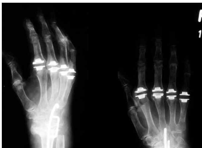
Abb. 3 Röntgenbild der Langfingergrundgelenke a.-p. und schräg. Versorgung mit Silastik-Spacern unter Verwendung von Grommets. NB: Arthrodesse des Handgelenks in der Technik nach Mannerfelt.

te medikamentöse Einstellung und lokale Infiltrationen sowie Physio- und Ergotherapie (Hilfsmittel) muss die beschriebene Dysbalance der Weichteile unbedingt vermieden werden (Abb. 2). Die Sonografie detektiert Synovialitiden der palmaren Strukturen (Beugesehen!) und wird intensiv zum Nachweis dieser Pathologie am Finger angeraten. Eine arthroskopische oder offene (dann mit Balancierung der Weichteile) Synovektomie der Gelenke ist bei Therapieresistenz gegebenenfalls frühzeitig zu indizieren. Die Synovektomie und Zentrierung der palmar verlaufenden Stabilisatoren (vor allem am MCP-Gelenk) scheint mehr Beachtung zu verdienen, als bisher klinisch offensichtlich ist.